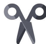
CONFEZIONE SARTORIALE SU MISURA